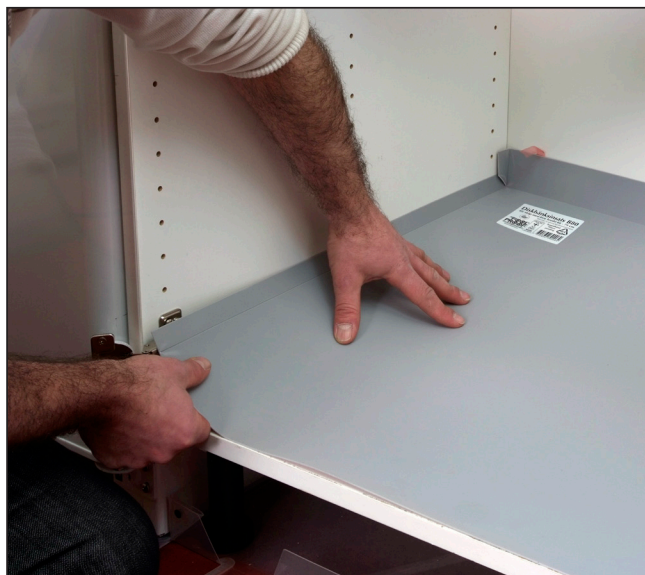
4. Lägg in insatsen i skåpet