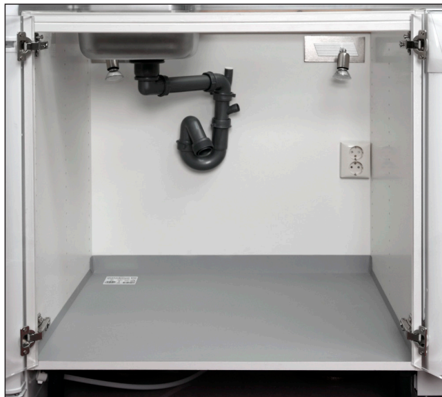
8. Ett vattensäkert diskbänkskåp, som uppfyller kraven i byggreglerna