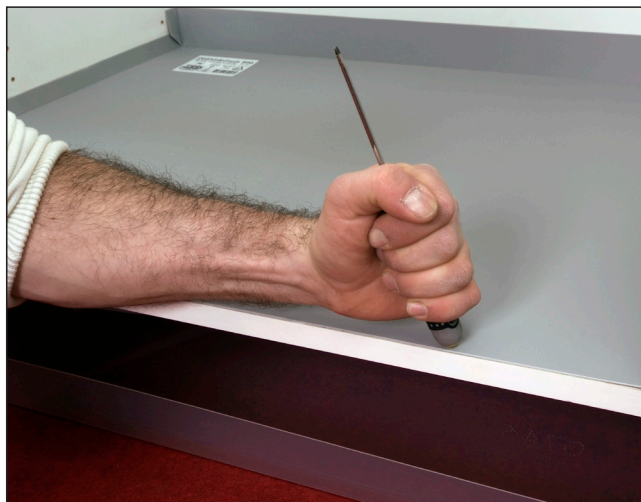
7. Pressa fast insatsen med ett hårt föremål mot de tejpade ytorna