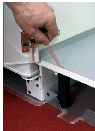
6. Dra bort skyddsfilmen under framkanten