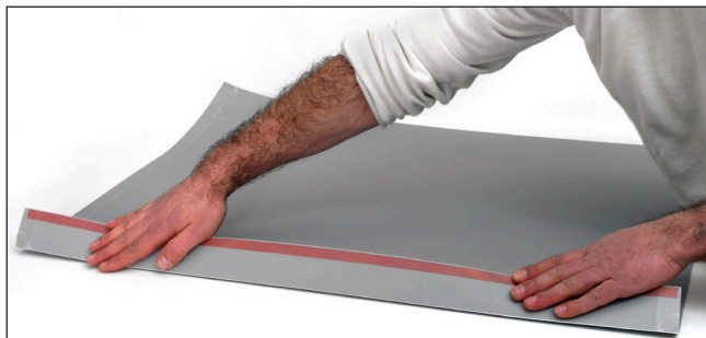
1. Vik upp den bakre sargen