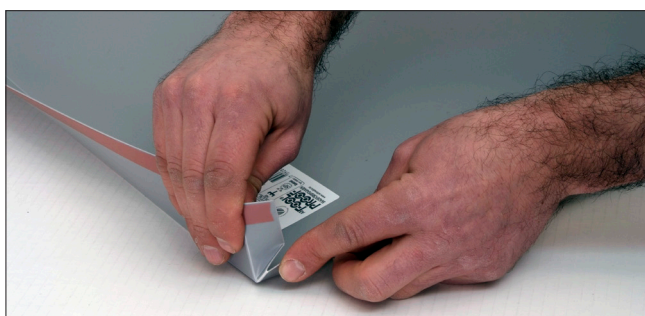
2. Vik upp både höger och vänster sarg