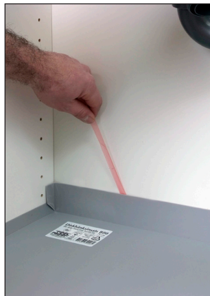
5. Dra bort skyddsfilmen från bakre sargen